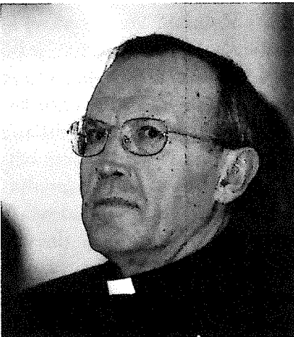
Nadškof dr. Anton Stres

Slovensko biblično gibanje iskreno čestita dr. Antonu Stresu za imenovanje za ljubljanskega nadškofa in metropolita. Naj Gospod obilno blagoslavlja Vaše služenje Cerкви, ki ga vršite v duhu Vašega gesla: »Vse zaradi evangelija.«