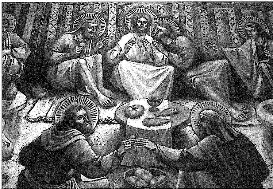
Zadnja večerja v refektoriju frančiškanske kustodije v Jeruzalemu, detajl

pogledih, ki delajo iz Kristusa zgodovinsko prigodo, ki ga osamijo v kozmosu kot dodatno epizodo in ki na videz naredijo iz njega pritepenca ali tujca v uničujoči in tuji brezmejnosti veselja« (navaja v: Cahier Evangile 82, 22).