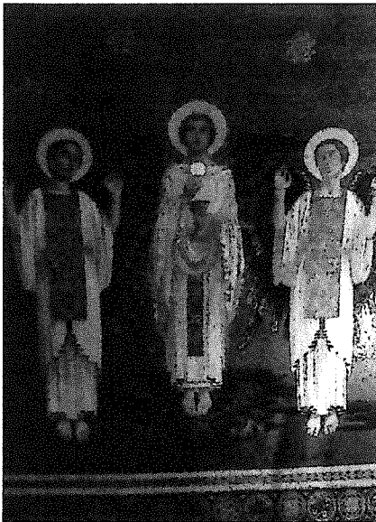
»Spremenitev«, mozaik na Taboru

Prva cerkev Božjega groba je bila enkrat daljša kot je današnja. Leta 315 za časa Konstantina je njegova mati Helena tukaj našla križ, ki zanj domnevajo, da je Jezusov. Ker je bila Helena odločilna za gradnjo cerkve, je njeno ime v kapeli. V bližini Božjega groba se po stopnicah spustimo v »podzemlje«, kjer je oltar sv. Helene (Helena s križem), še nekoliko nižje je jama, kjer je bil najden Sveti križ. Stene v živi skali v jami so vse označene s križci romarjev. Mozaiki iz 4. stol. so v enakem stilu kot v Tabgi. V 4. stoletju postane krščanstvo državna religija. Prvotna bazilika je iz 4. stoletja. Poznejša oblika bazilike je nastala v 7. stoletju in je bila dolga 172 metrov. Sedanja oblika je iz križarskega obdobja (12. stoletje). Vključuje Golgoto – mesto križanja (desno) in Božji grob (levo). Do kapele sv. Helene navzdol je deset metrov višinske razlike. Področje tu je bilo valovito in skalnato. Za cerkvene temelje so morali napraviti ravnilo in kamnolom zravnati. Jezusov grob je moral ostati, zato so vse naokrog sekali v živo skalo, da so tla zravnali in skalo, v katero je bil zasajen križ, bistveno znižali, le Jezusov grob so ohranili in izolirali. Božji grob je vsekani v skalo – kot