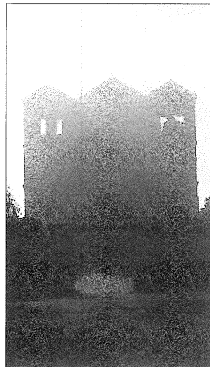
Zgodaj zjutraj, ko so megle še pokrivalo Jezraelsko dolino, smo se začeli vzpenjati na Goro spremenitve.

Naslednje jutro smo se prebudili v prenočišču Maison d' Abraham, ki je med zelenjem, z enkratnim pogledom na Jeruzalem. Do naše hiše ne moreš prispeti, da se te vsaj malo ne bi dotaknil Getsemani. Po zajtrku se odpravimo pred dom in pri zidu pogledamo na Jeruzalem. Iz Galilejske mehkode smo čez puščavski svet prišli v hrup in množico.