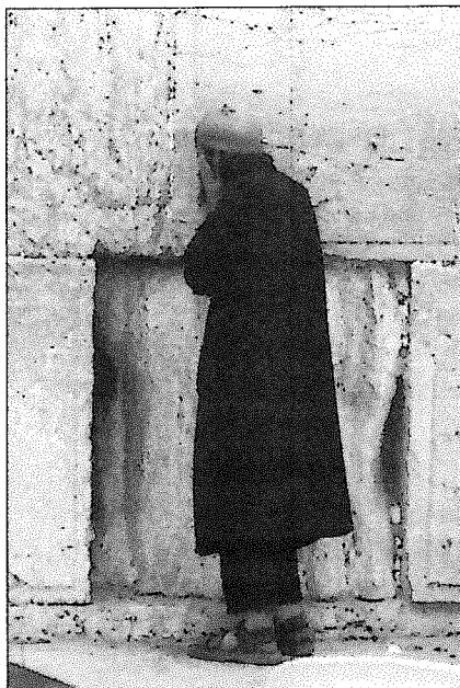
»Gospod je sklenil, da unci obzidje hčere sionske ... V žalost je zavil okop in obzidje ... Moje oči točijo solze« (Zal 2,8; 1,16).

stopili na Pot. Vstopili smo na dvorišče pred baziliko oznanjenja. Že arhitektura te zgradbe na čudovit način prikazuje veličino dogodka: Vsemogočni je na tem mestu stopil k človeku. Tukaj je Bog dokončno sestopil k človeku. Na novo smo obudili gorečnost za molitev Angelovega češčenja zjutraj, opoldne in zvečer, saj je to spominjanje, kako velike reči je Gospod za nas storil in izkušanje živega Boga v vsakem trenutku dneva. V cerkvi svetega Jožefa smo obhajali sveto evharistijo, pri kateri smo bili povabljeni, da začnemo izpuščati stvari, ki smo jih nosili s seboj in pripravimo prostor Besedi.