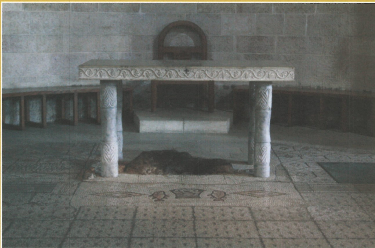
Tabgha, kraj pomnožitve kruha