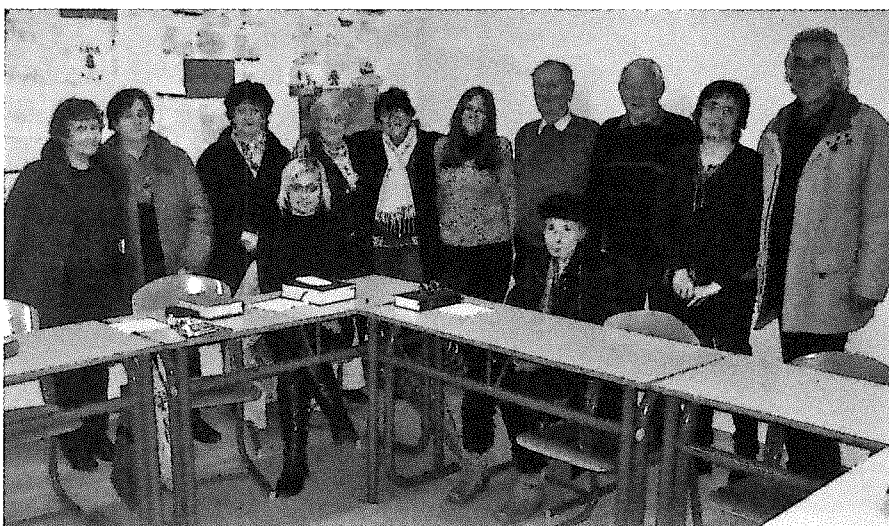
Člani biblične skupine župnije Sv. Križa v Mariboru