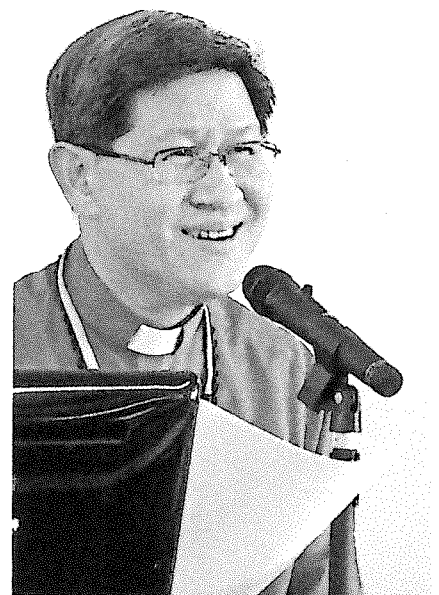
Kardinal Luis Antonio Tagle