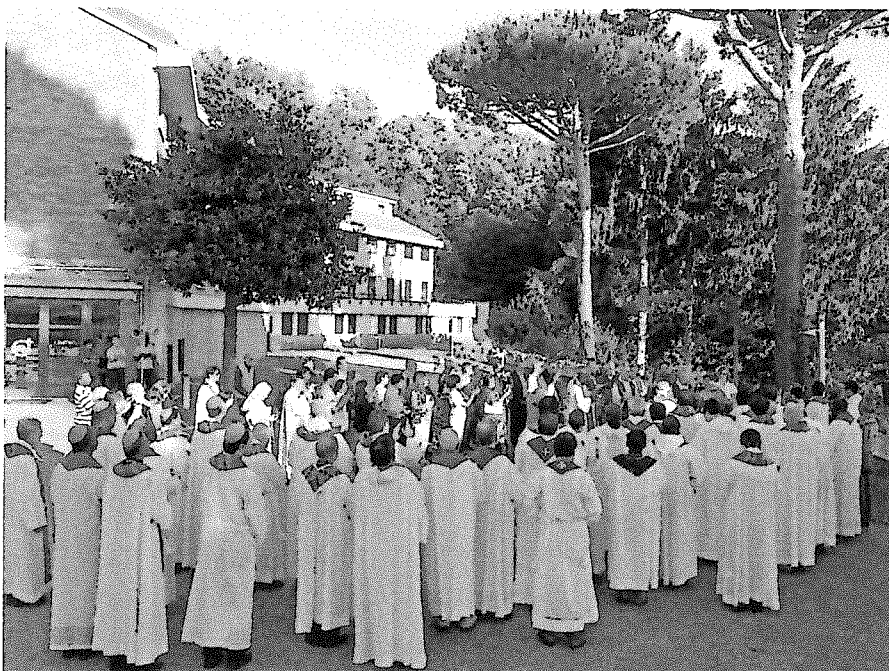
Sklepni blagoslov udeležencev skupščine

Rad bi vas spodbudil, da dobro spoznate Božjo besedo, in sicer skozi Sveto pismo in nauk Cerkve, toda ne toliko z namenom, da bi jo spoznali razumsko – kar je tudi pomembno – temveč z namenom, ki je še pomembnejši: da osebno spoznamo Boga, da spoznamo Jezusa, da vstopimo v njegovo misel, da vstopimo v njegovo srce, da bi tako njegova misel in njegovo srce resnično postala naša misel in naše srce. Takrat bo vse naše govorjenje, misli in delovanje izžarevalo Jezusa – Njega bodo videli, Njega bodo slišali. Molim za vse vas in vas obenem prosim, da tudi vi molite zame.