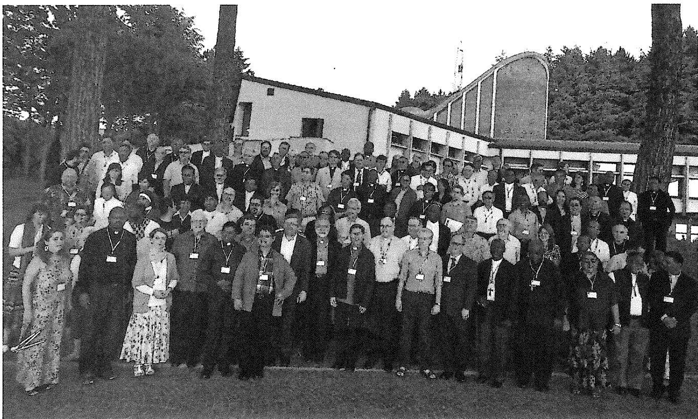
Skupinski posnetek udeležencev skupščine

Papež je vse zbrane spodbudil h gorečnosti v oznanjevanju in zavedanju, da je Sveto pismo resnični izvir oznanjevanja, v nagovoru pa