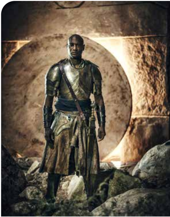
Angel iz TV-serije Anno Domini

Bolj ko je vstajenje nazorno prikazano, večja je njegova karikatura.