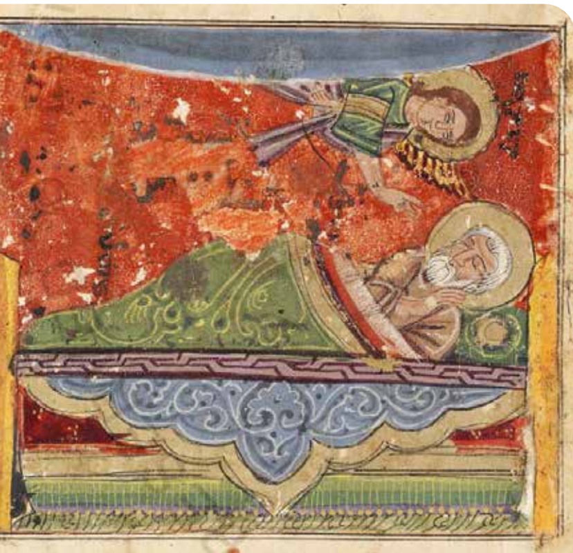
Razodetje Jožefu v sanjah (Vat. sir. 559, f. 12v, zač. 13. stol.)

Jožef je bil imenovan oče Jezusa Mesije. Jezus se je rodil iz Marije, Device, iz semena Davidove hiše, iz Svetega Duha, kakor je zapisano, da sta bila oba,