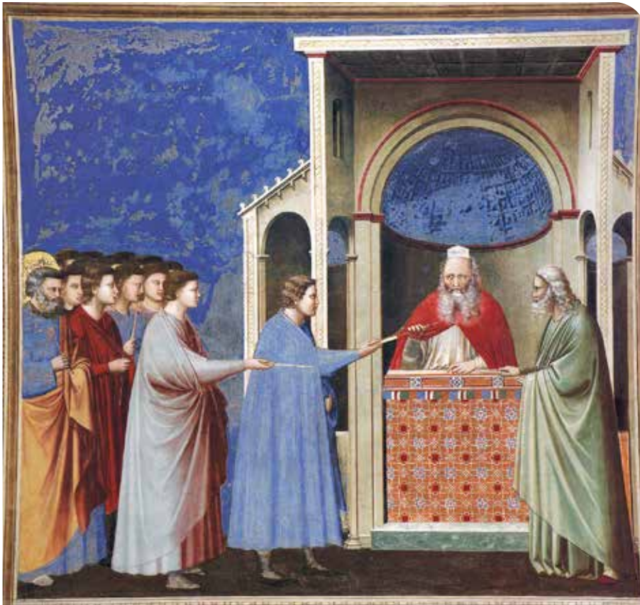
Vdovci v tempelj prinašajo svoje palice.

Marijino deviškost oz. želi odstraniti dvome glede domnevnega očetovstva Jožefa.