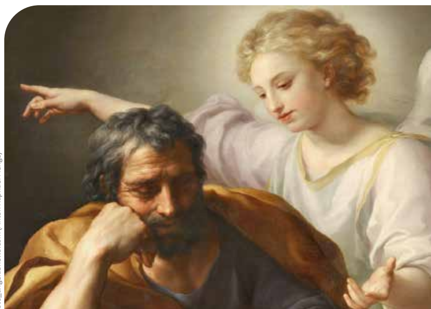
(Anton Raphael Mengs)

Kanonični evangelijski nikoli ne omenjajo Jožefove starosti. Avtor apokrifnega besedila ga drugače predstavi kot ostarelega vdovca, ki ga je žreb, tj. Bog, izbral za varstvo device Marije. Jezusovi bratje, ki jih omenjajo tudi kanonični evangelijski, so predstavljeni kot Jožefovi otroci iz prejšnjega zakona. Prav Jožefova leta in njegova spodobnost –