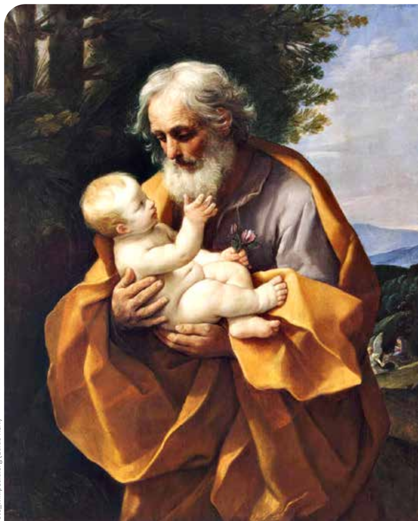
(Guido Reni)

Besedilo iz osmega in devetega poglavja Jakobovega protoevangelija nam torej predstavi Jožefa kot ostarelega vdovca s sinovi iz prejšnjega zakona. Besedilo hkrati naglasi Božjo previdnost, saj je bil Jožef izbran z žrebom velikega duhov-