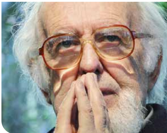
foto_dmz's (Ignacio Larrañaga)

Začel je s tedenskimi srečanji, ki jih je imenoval Izkušnja Boga. Videl je, kako so ljudje vzpostavili nov, osebni odnos z Bogom, se naučili moliti in na drugačen način gledati na življenje. S skupino zavzetih laikov je preizkušal molitvene načine