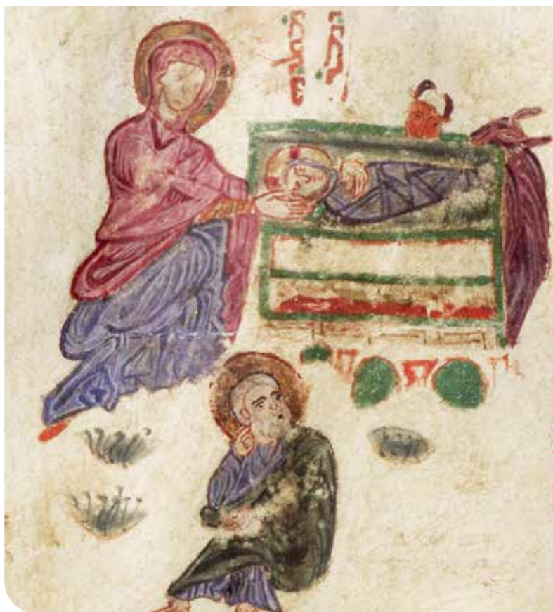
Jezusovo rojstvo (Berlin Sachau 220, f. 3r, 11. stol.)

V drugi homiliji Proti heretikom Efrem izpostavi lik tesarja Jožefa. Bog Oče je celotno veselje oblikoval s prstom svojega Sina in na enak način je Jožef s svojim Sinom opravljal tesarsko delo. Podredil se je svojemu Sinu, ki je za Jožefa postal Učitelj (sir. sāprā ). Sin tesarja, ki je Jožefa učil tesarske umetnosti, je v skrivnosti križa ustvaril vse. Efrem napravi analogijo med tesarstvom in Sinovo smrtjo na križu ter potrjuje, da je bil Božji Sin ves dan zaposlen v svoji hiši z Jožefom in Marijo z izdelovanjem svojega križa, v katerem je bilo treba doseči