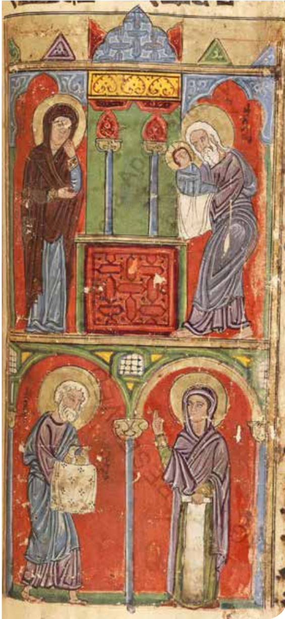
Jožef z grlicama spremlja Jezusovo darovanje v templju (Vat. sir. 559, f. 48v, zač. 13. stol.).

posilstva, zopet drugič govori preprosto o njegovem dvomu. Po tej notranji krizi, potolažen od angela Gabrijela, Jožef postane čisti zakonec Marije, s katero ohrani deviškost do smrti. Je domnevni oče, posebni Božji služabnik in zato najodličnejši Aronov duhovnik, zagovornik in ščit Marijinega devištva pred ljudmi.