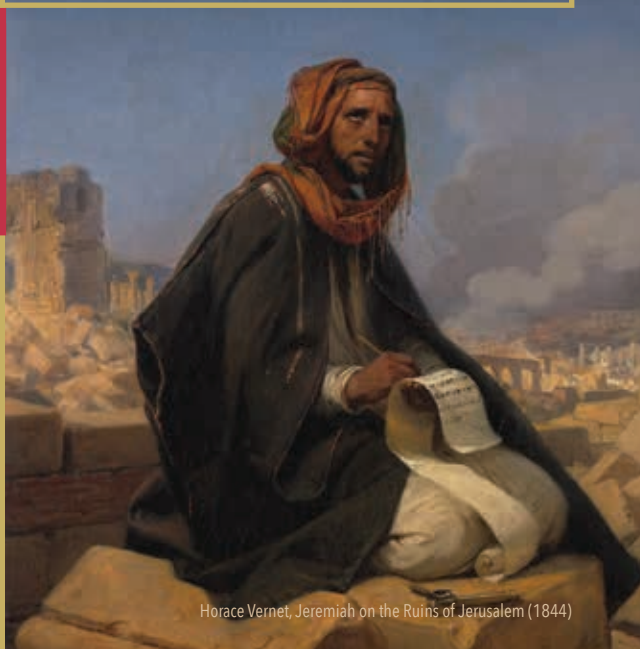
Horace Vernet, Jeremiah on the Ruins of Jerusalem (1844)

Zaželeno je, da se prijavite na https://biblicnogibanje.si/biblicna-sola/ Vabljeni!